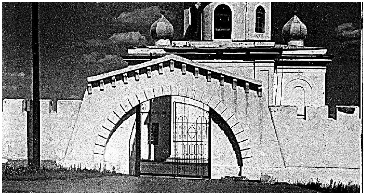
Fig. 2. fortezza Naslednitskaya